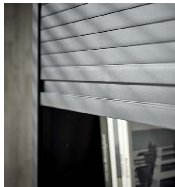
Matte Optik aus jedem Winkel

Stauraumlösungen für jeden Geschmack, ohne Kompromisse bei der Funktionalität – das ist das Ziel unserer „The art of storage“ Kollektion. Ob Edelmatt, Glasoptik oder Metall, ob Rollläden oder FLIPDOOR System, Sie entscheiden, welcher Schrank der Richtige für Sie ist. Passende Oberflächen und Kanten im Designverbund runden das Angebot ab.