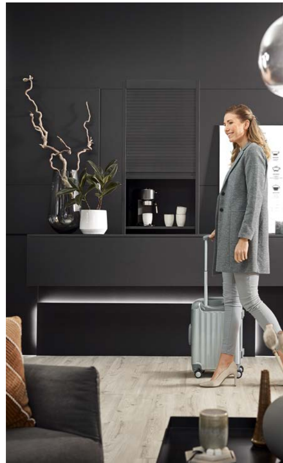
Der perfekte Designverbund